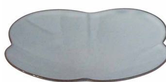
ハナハナ浅ボウル