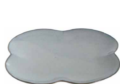
ハナハナプレートS

何気ない毎日の食卓に花を飾るようにー。 日常の中にほんの少しの遊び心やアクセントを。食卓を彩る普段使いの器。