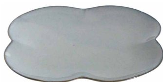
ハナハナプレート